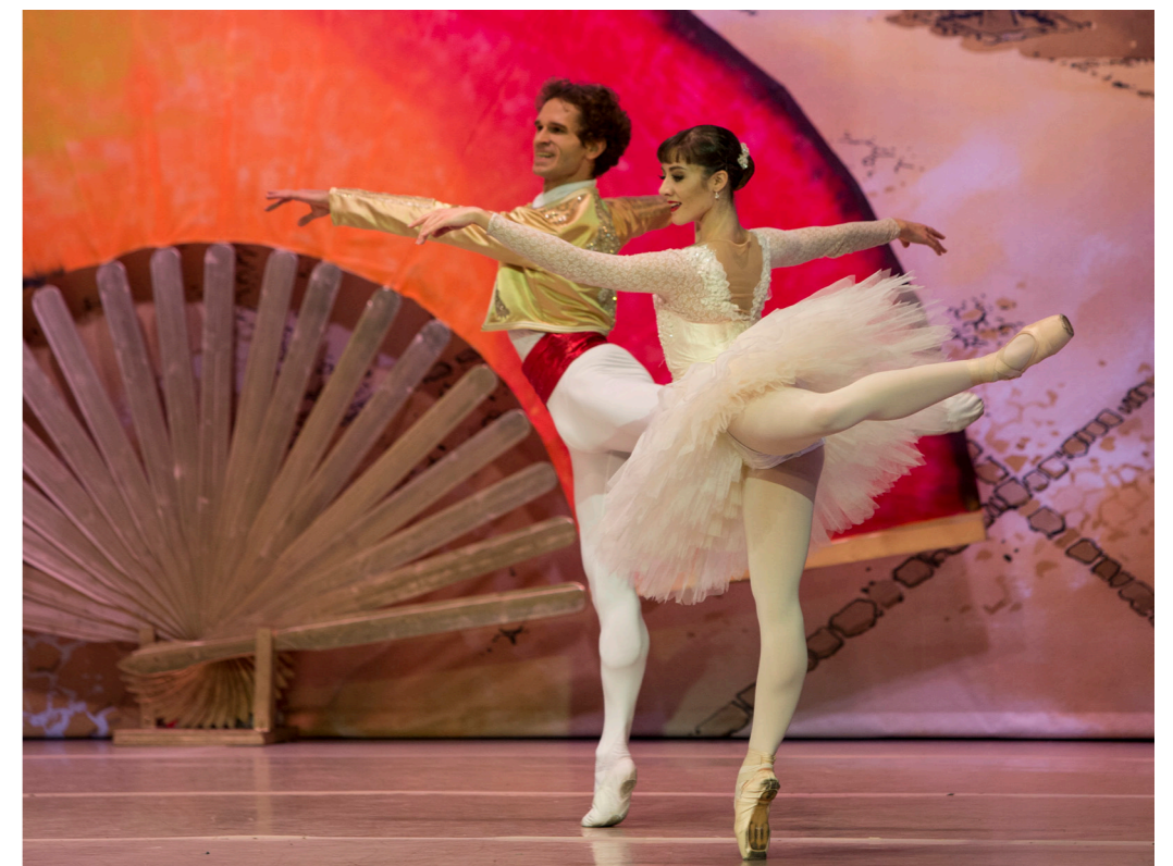
Don Quixot. Ballet de Catalunya

21-24 feb. 20h; dom 18h. 28€. En esta obra los bailarines exploran el diálogo y el conflicto entre el movimiento y el contenido que representa. El coreógrafo busca incluir a la audiencia en su propia libertad a la hora de crear su arte. GN|MC Guy Nader|Maria Campos: Tarannà. Un solo de Maria Campos 23, 24 feb. Sáb 18h; dom 12h. 12€. Un solo en torno al concepto de "transformación" a través del objeto, el espacio y el cuerpo.