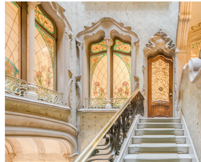
Casa Felip. Cases Singulares

(Passeig de Gràcia, 92). M: Diagonal (L3, L5); FGC: Provença. La Pedrera de Día: diario 9-18.30h. 22€. La Pedrera de Gaudí. Los Orígenes: diario 19-21h. 34€. El despertar de La Pedrera: jue, vie 8h (ing), 39€. Muchos barceloneses la consideran la verdadera obra maestra de Gaudí. Las líneas onduladas de la fachada, el impresionante terrado y los originales rasgos interiores son algunos de los elementos más destacados. Recientemente se han inaugurado nuevos audiovisuales que realzan la conexión entre La Pedrera y la naturaleza, el elemento clave de inspiración de Gaudí, para ofrecer al visitante una experiencia sensorial única.