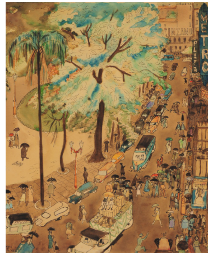
Lina Bo Bardi. Fundació Joan Miró.