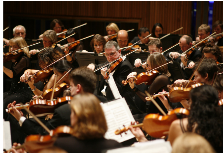
London Philharmonic Orchestra en el Palau de la Música