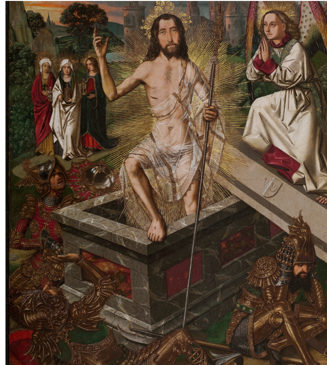
Bartolomé Bermejo. Museu Nacional de Catalunya