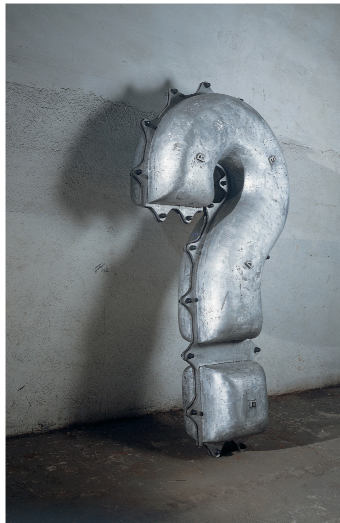
Jaume Plensa. Firenze II. 1992. MACBA

y futuro de la planta del cannabis y su potencial para usos industriales, nutricionales, medicinales y recreativos.