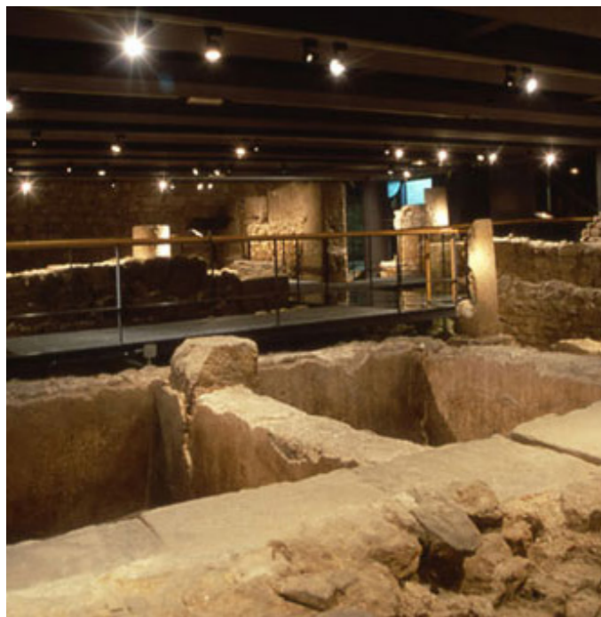
Museu d'Història de la Ciutat